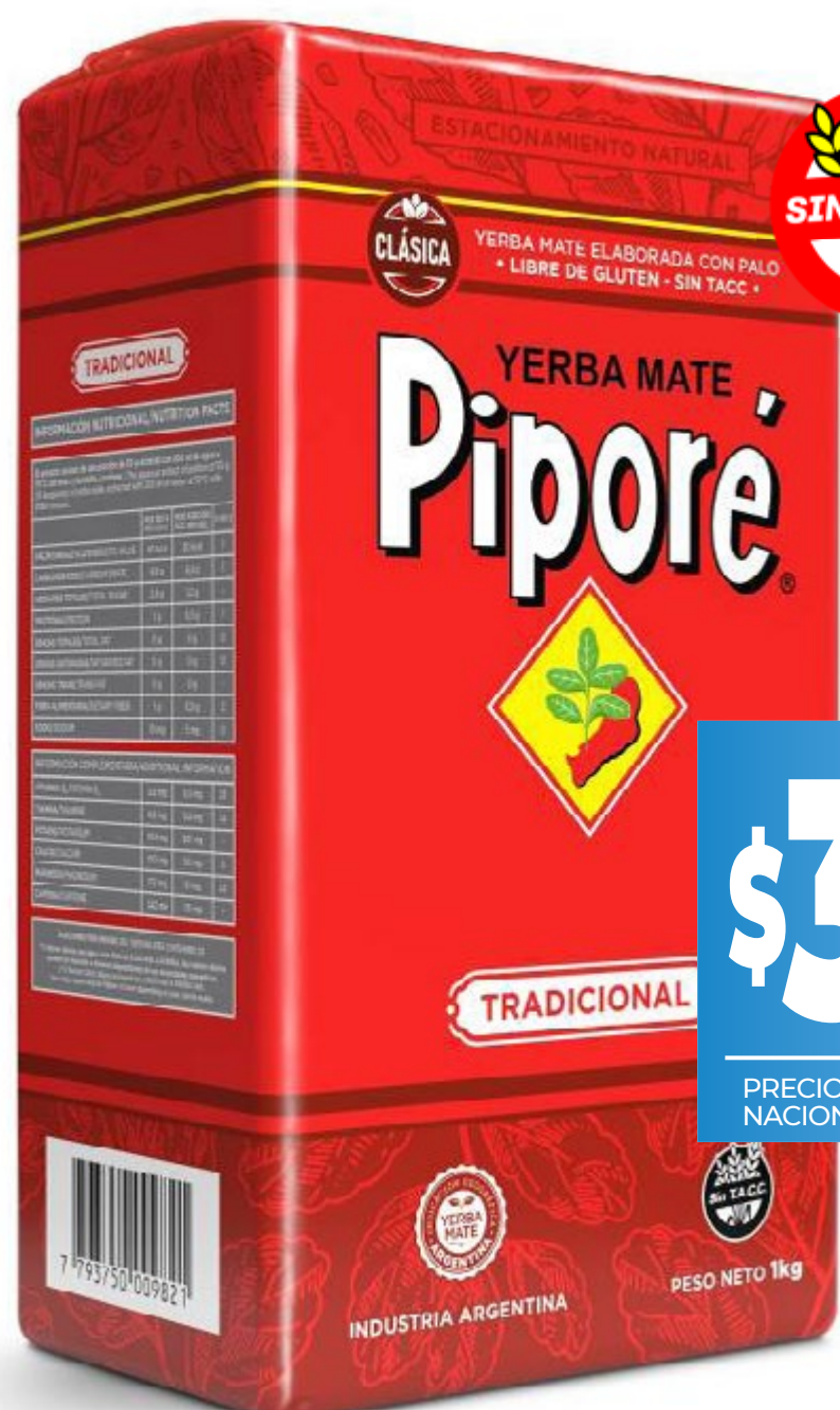
Yerba Mate con Palo "Piporé" Tradicional x 1 Kg. *1.000