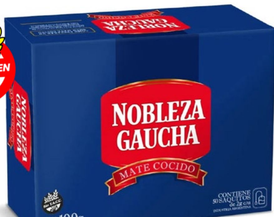
Mate Cocido en Saquitos "Nobleza Gaucha" x 50 unid. *1.000

PRECIO SIN IMPUESTOS NACIONALES $ 2.719 01